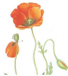
aus: Volak/Stodola/Servera, Das große Buch der Heilpflanzen, 1983; Aichele/ Golte-Bechtle, Was blüht denn da?, 1988

b) Warum sind sie heute selten geworden?