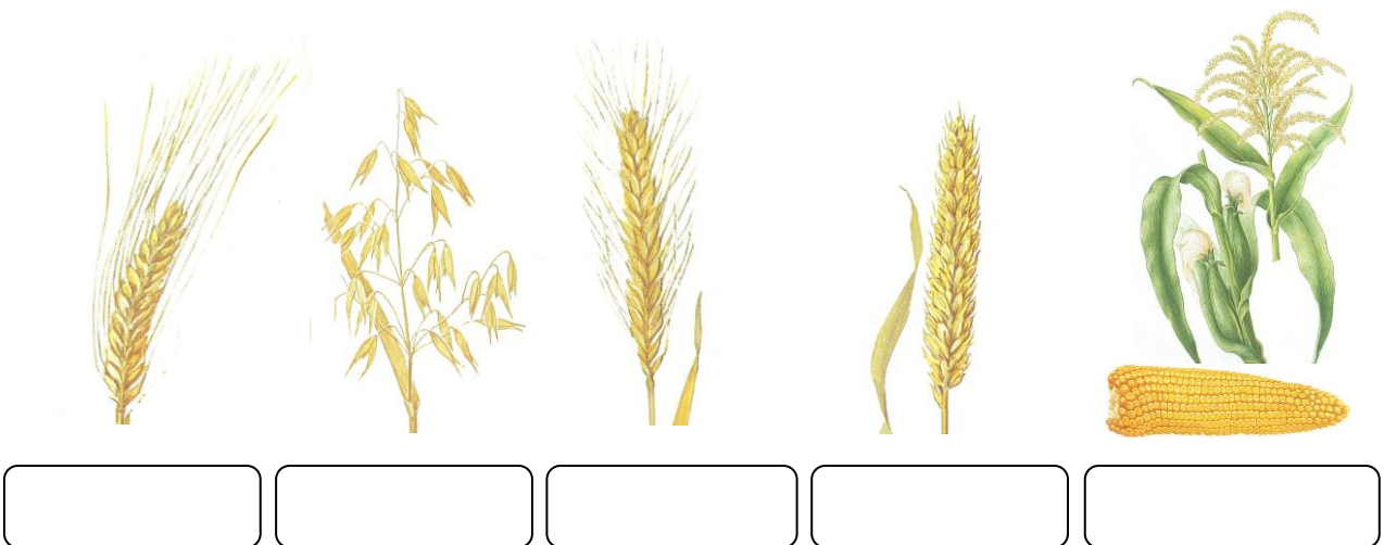
aus: Christiansen/Hanke, Gräser, 1988; aus: Volak/Stodola/Servera, Das große Buch der Heilpflanzen, 1983

2. Kennst du die Getreidearten? Trage die Namen darunter ein.